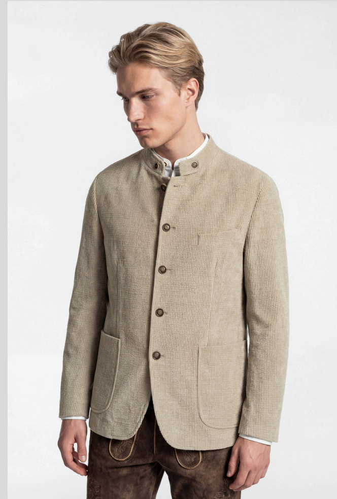
Trachtenjanker 5435 in Cord-Optik