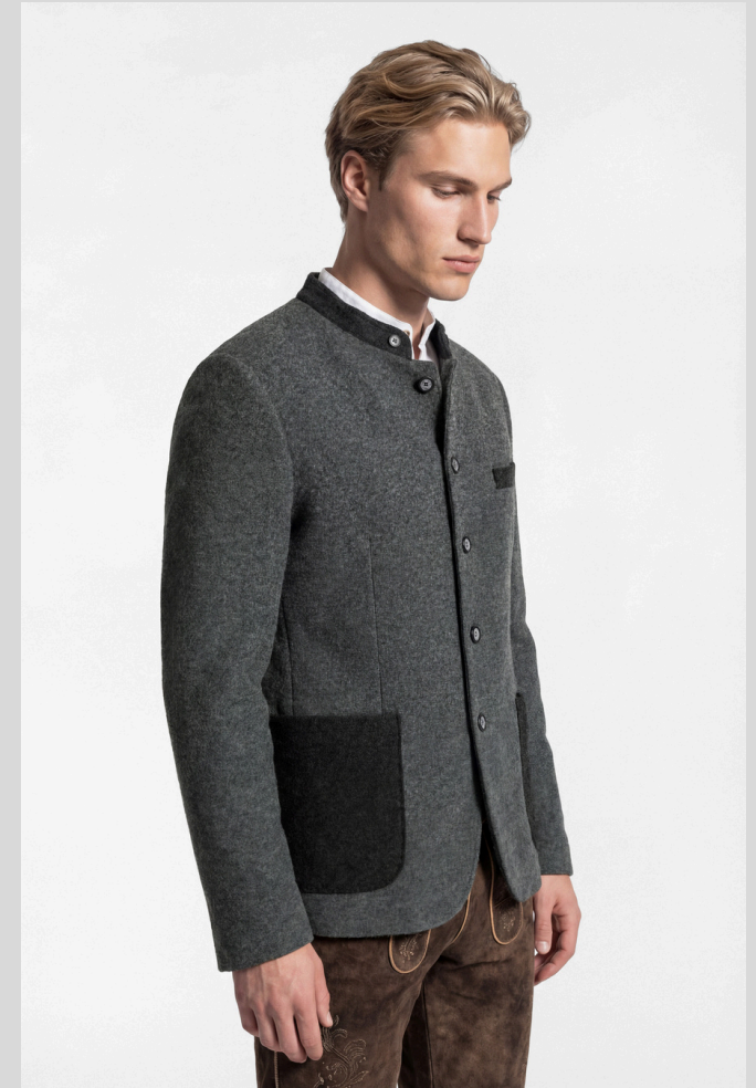
Trachtenjanker 5446 in Woll-Optik