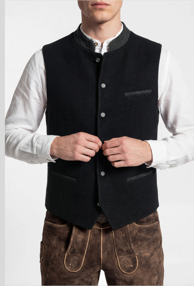
Trachtenweste 5446 in Woll-Optik